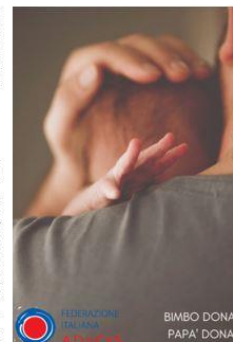
FEDERAZIONE ITALIANA ADoCeS BIMBO DONA, PAPA' DONA

Sono 1800 ogni anno i malati di leucemia, mielomi, linfomi, aplasia, stati di immunodeficienza, malattie autoimmuni, tumori solidi come il neuroblastoma ed altri) che hanno bisogno del trapianto di CSE per poter guarire. Non avendo un familiare compatibile, va trovato fra le donazioni di sangue cordonale e i donatori disponibili presso Registro Italiano Donatori IBMDR. Le CSE sono un Livello Essenziale di Assistenza del Servizio Sanitario Nazionale. I papà che non abbiano compiuto i 36 anni, sono preziosi perché, assieme alla donazione del sangue cordonale, possono offrire ai malati un doppio dono, quello dell'iscrizione al Registro.